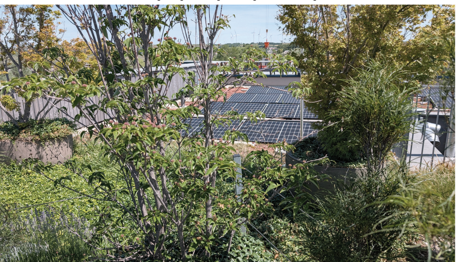
Abb.: Intensive und extensive Dachbegrünung als Beitrag zur ökologischen Aufwertung